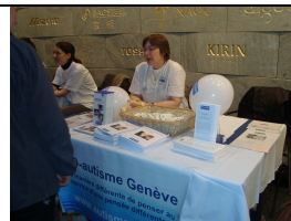
Journée mondiale de l'autisme