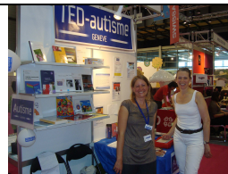
salon du livre 2011